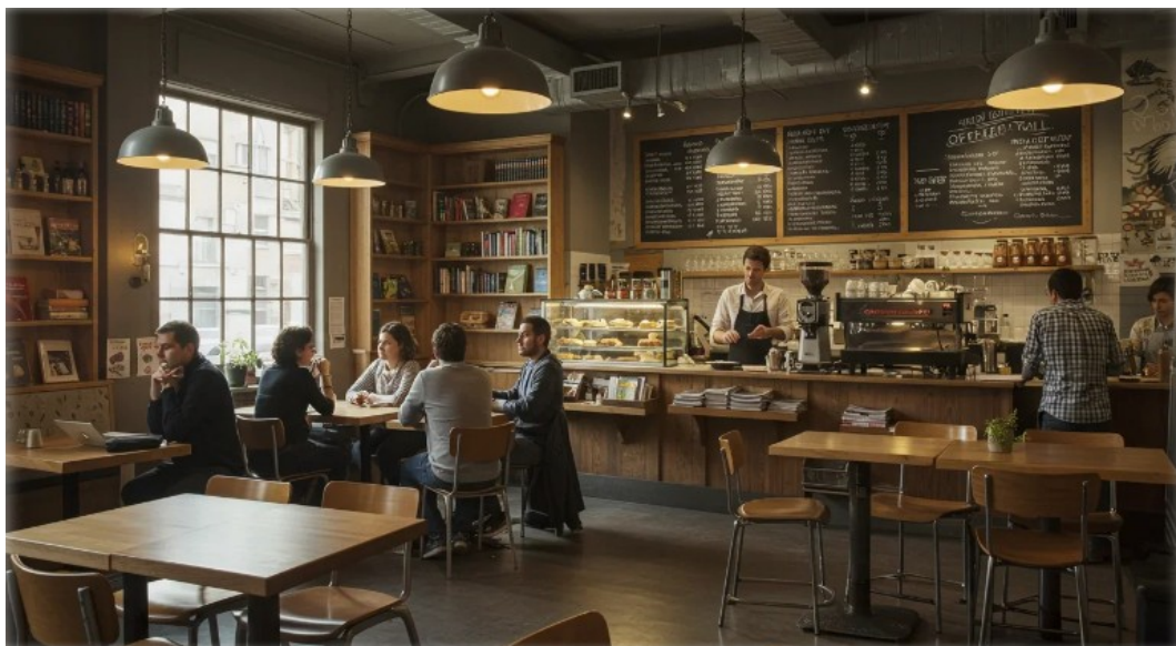
Verschwindende ‚dritte Plätze‘

Die gezielte Zerstörung des öffentlichen Nahverkehrs und die Förderung der Zersiedelung sorgen dafür, dass die Menschen Stunden allein in ihren Autos verbringen, voneinander getrennt durch Entfernung, durch Mauern, durch Autobahnen, die eher auf Geschwindigkeit als auf Begegnung ausgelegt sind. In den Vororten gibt es keinen „dritten Ort“; kein Café, keinen Platz, keine Parkbank, an der sich Menschen spontan versammeln. Es gibt nur das Zuhause, das Auto und den Großmarkt.