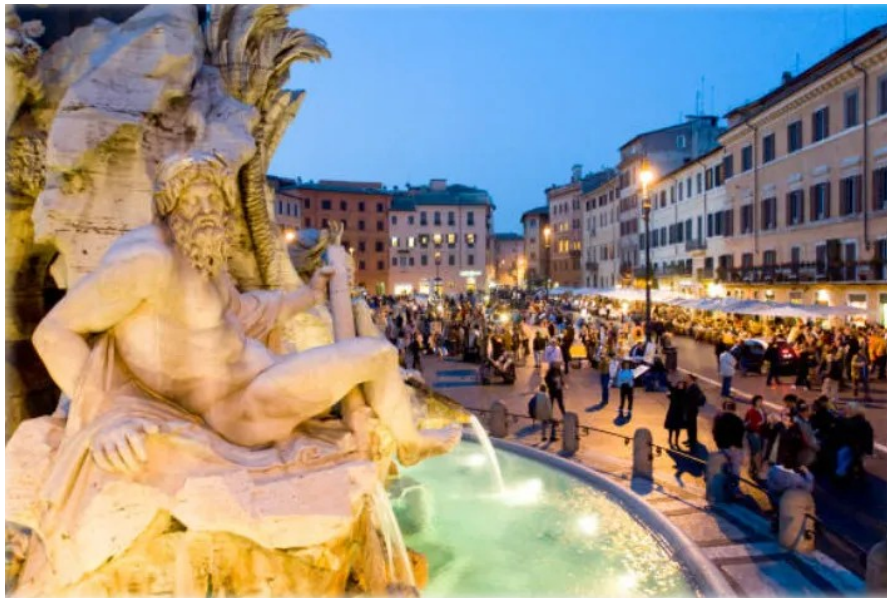
Der Platz war das Wohnzimmer des Viertels. Abends kamen alle hierher, um zu essen, Kaffee zu trinken, zu plaudern und sich zu unterhalten. Es herrschte ein ständiger Austausch unter den Menschen.

plaudern und sich zu treffen. Die Kinder und Haustiere spielten. Wir sahen immer wieder dieselben Gesichter und lernten uns kennen. Wir waren alle „wir“; ein Teil von etwas. Es gab ständigen menschlichen Kontakt. Ein paar hundert Meter in jede Richtung entfernt befand sich eine weitere Piazza, deren Funktion derjenigen glich, auf der ich lebte. Das Leben hatte eine Fülle, die schwer zu beschreiben ist, weitaus reichhaltiger als in den nordamerikanischen Vororten mit den Einfamilienhäusern und gepflegten Rasenflächen, die zwar hübsch waren, aber durch ihre Gestaltung atomisiert wirkten.