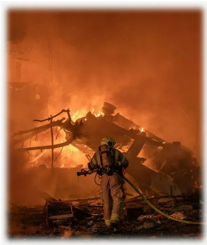
Zentral-Tel Aviv in Flammen nach einem iranischen Einschlag.

Wie ich bereits in einem früheren Artikel mit dem Titel „Israelische Zensur des Iran-Kriegs“ [1] dargelegt habe, ist die Kontrolle der israelischen Medien über die durch iranische Raketenangriffe verursachten Schäden sowie die Zensur – sowohl im Inland als auch international – extrem.