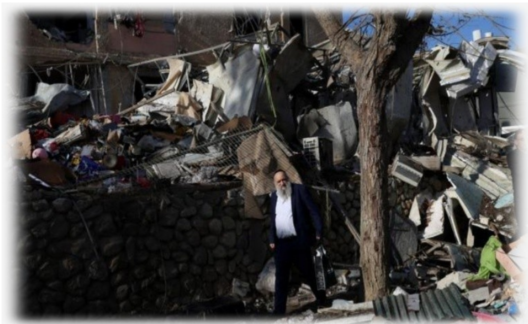
Ein Mann geht am 22. März 2026 in Dimona im Süden Israels zwischen Trümmern umher, nachdem iranische Raketenangriffe Dutzende Israelis verletzt hatten.