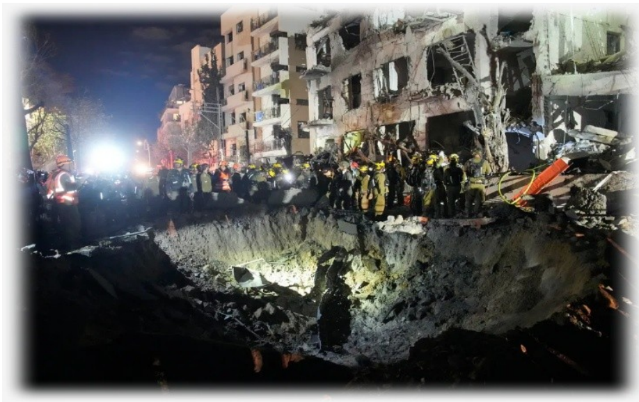
Bombenkrater in Tel Aviv.

Der Jewish News Service berichtet, dass im Rahmen der „Operation Roaring Lion“ zahlreiche Luftschutzbunker auf landwirtschaftlichen Flächen errichtet wurden, um jüdische Bauernhöfe zu schützen [16]. Dies geschieht nicht durch die Regierung – die die Bauern sich selbst überlassen hat –, sondern durch öffentliches Crowdfunding.