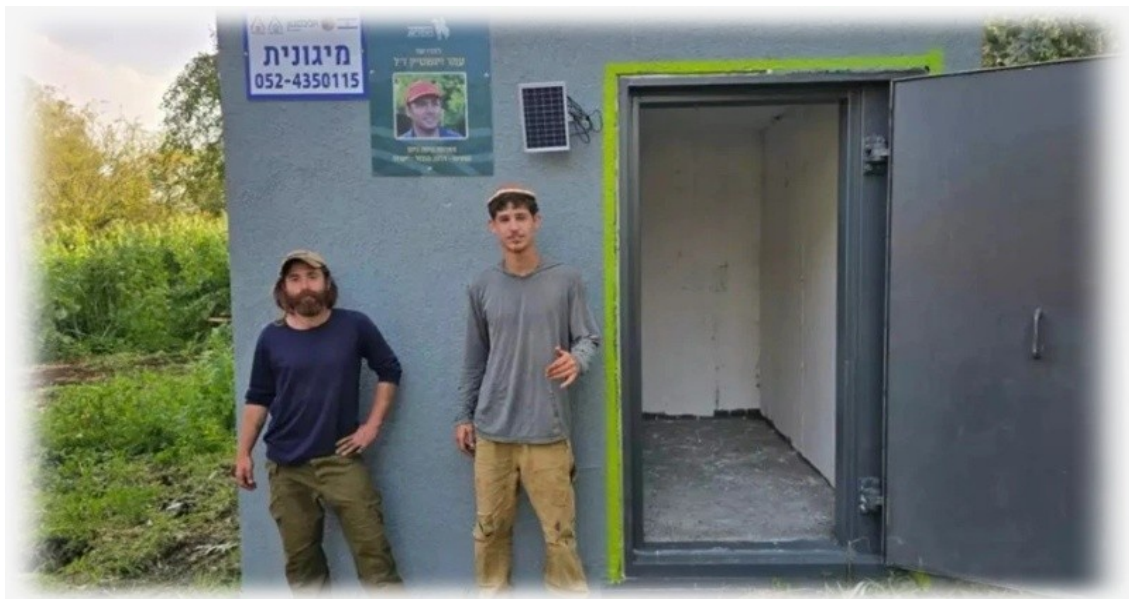
Schutzbunker für Zivilisten – es gibt zu wenig davon und sie sind nicht wirksam. (Ohne Quellenangabe)