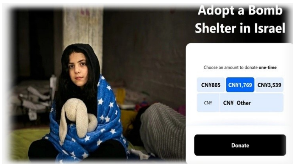
Spendenaufwurf für Luftschutzbunker.

Die Zivilbevölkerung ist so verzweifelt, dass sie Bombenschutzräume per Crowdfunding finanziert; sie zahlt sehr hohe Preise für jede Unterkunft mit einem „Schutzraum“; Militärangehörige weigern sich, ihren Dienst anzutreten, weil es an Schutz vor iranischen Raketen mangelt. Es scheint, als seien die Berichte, wonach „Iron Dome“ und „David’s Sling“ 99 Prozent der iranischen Raketen abfangen, möglicherweise nicht wahr.