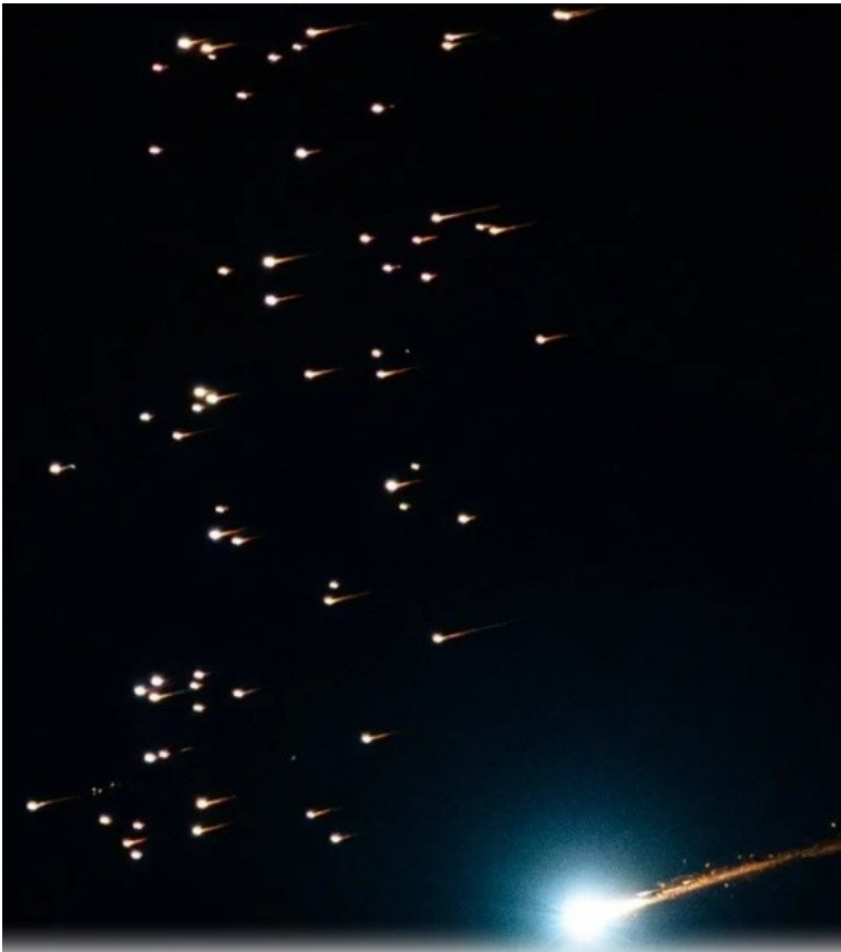
Iranische Streumunition.

Ha'aretz erneut: „Neun Menschen wurden getötet und 60 verletzt, nachdem eine Rakete Zentral-Israel getroffen hatte“ [30]. Und: „Israel konnte eine iranische Streurakete nicht abfangen. Das ist der Schaden, den sie angerichtet hat“ [31]. Und noch einmal: „Irans Streumunition: Was Sie über die umstrittene Waffe wissen müssen, die auf Israel abzielt“ [32]. Die Jerusalem Post berichtete ähnlich (mit einem guten Video). [33] Als sich die Schäden ausweiteten und immer schwerer einzudämmen waren, verhängte Israel eine vollständige Nachrichtensperre über die von Iran getroffenen militärischen und strategischen Ziele und gab nur zivile Treffer bekannt. [34]